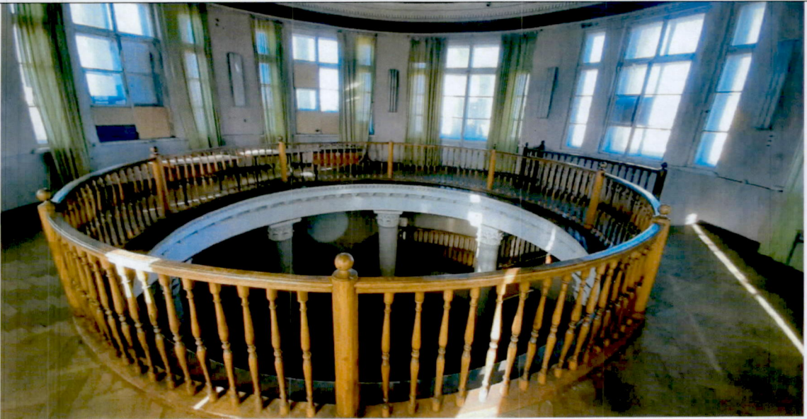
7. Ротонда, 6-й этаж