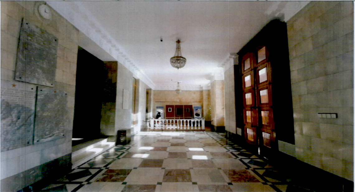
4. Парадный вестибюль