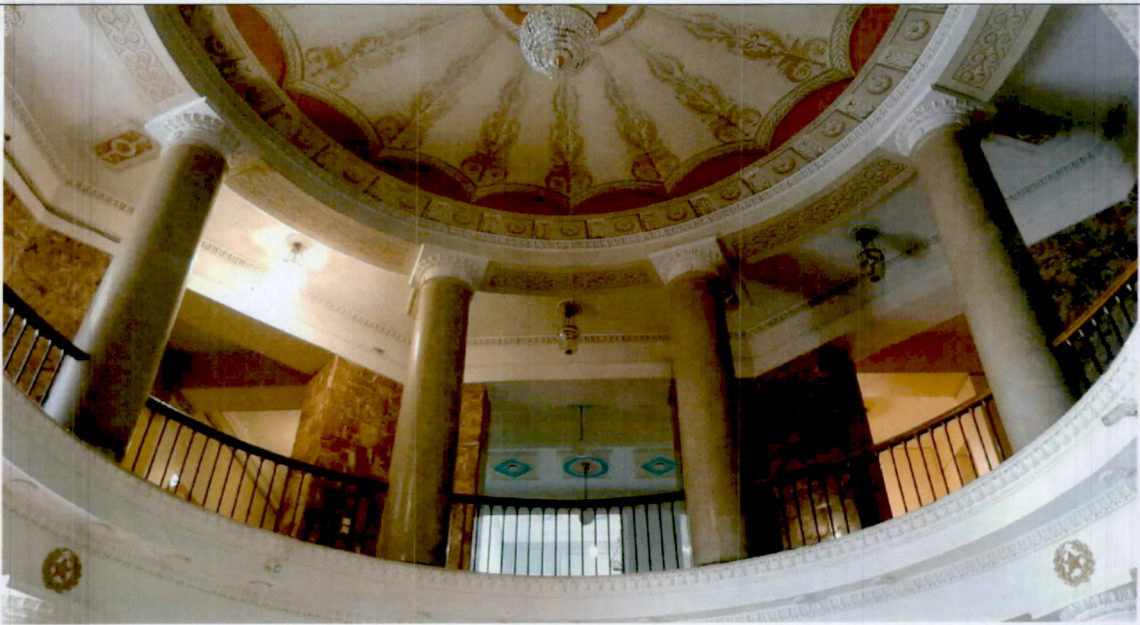
6. Ротонда 2-й этаж