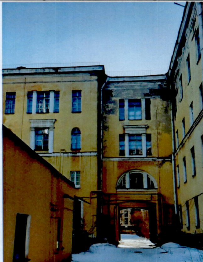
2. Фрагмент северо-западного фасада