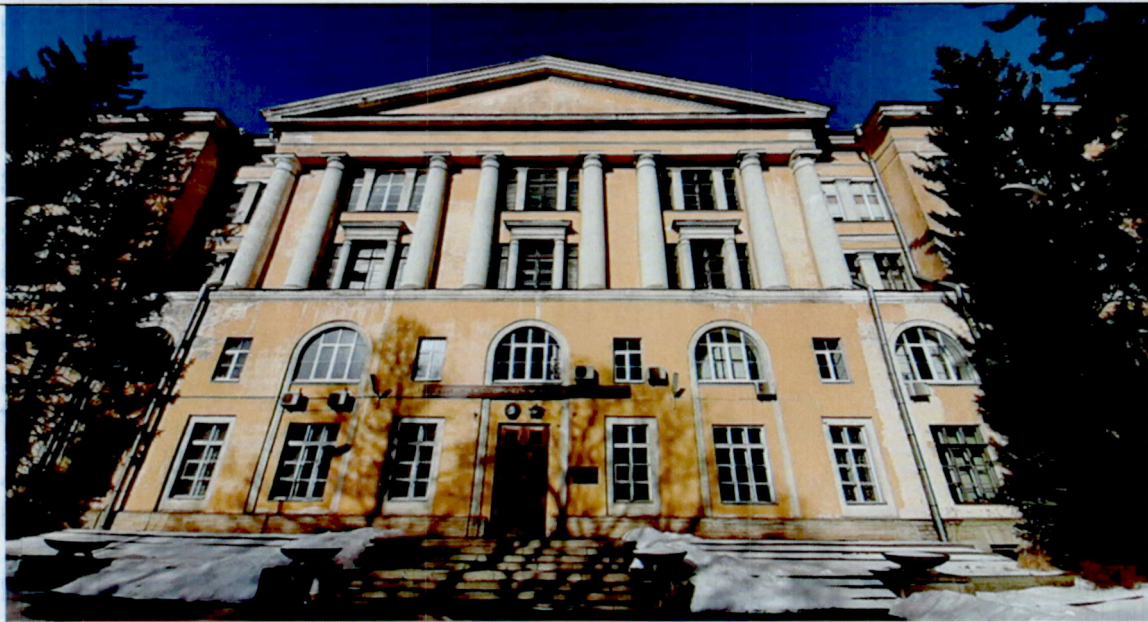
1. Фрагмент юго-восточного фасада

Фотографическое изображение объекта культурного наследия регионального значения «Главное здание Государственного оптического института имени С.И. Вавилова», являющегося частью здания, расположенного по адресу: Санкт-Петербург, Кадетская линия В.О., дом 5, корпус 2, литера В (фотофиксация выполнена 02.03.2023).