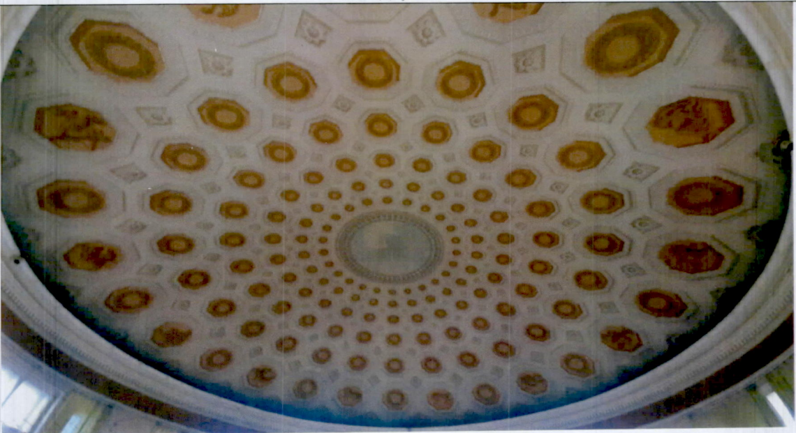
8. Ротонда, плафон 6-го этажа