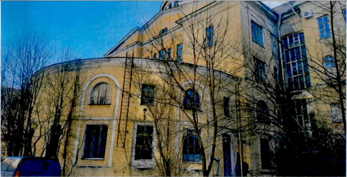
3. Фрагмент северо-западного фасада (объем конференц-зала)